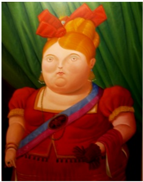
Fernando Botero, Prvá dáma

materiálne bariéry: Pudia sa boja návštevy blízkych či večera v bare, najužší rodinný kruh je centrálnou a často jedinou sociálnou skupinou, v ktorej jednotlivci participujú, a to i po dosiahnutí dospelého veku. Ulica a vonkajší svet sú primárne vnímané ako ohrozenie, vyvíjajú sa národné komplexy menejcennosti, pocit bezradnosti. Mnoho z týchto prívlastkov cítite v Kolumbii dodnes.