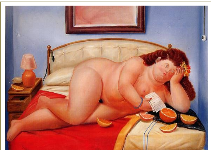
Fernando Botero, La Carta, List

Obraz Kolumbie je od začiatku až do samého konca príbehom Sveta za pohľadnicou . Napokon, platí to aj v doslovnom zmysle: globálny turistický priemysel ju ešte stále obchádza, nie sú tu päťhviezdičkové rezorty a skutočnú pohľadnicu si kúpite len po dôkladnom hľadaní. Boja sa jej ešte aj nezávislí cestovatelia, ktorí vlezú takmer hocikde. Nikto o nej nič poriadne nevie, samozrejme, okrem Hollywoodu, keďže kolumbijská téma sa objavuje v každom jeho sračkovom filme o kokaínovej chobotnici. Televízne správy, tí priatelia vojen a nestability, si ju radi berú do úst ako vd'ačný región vždy, keď nie je o čom hovoriť kdesi bližšie. Ešteže má Gabriela Garcíu Márqueza, nenávideného vlastnými rodákmi. Kedysi sa vraj postavil za tých, ktorí holdovali Fidelovi Castrovi a v krajine zatiaľ rozbíjali plantáže ; doma mu to nemôžu zabudnúť. Ako uvidíme, marxistická ideológia a kokaínový biznis sa k sebe v Kolumbii pekne hodili: Márquez však rád písal len o fašistoch a konzervatívcoch. Keď začali byť únosy a vraždenie prevádzkované jeho kamarátmi, kokaínovými partizánmi, fakt dobrou témou na knihu, Márquez zdrhol do Mexika. Doma sa ukazuje len ak mu rozprávko zaplatia v nejakej televíznej šou. Takto o Márquezovi a jeho knihách hovoria domáci. Čo možno teda očakávať od imidžu krajiny, vraj jednej z najbezpečnejších na svete, keď ešte aj jej nobelový autor upadá do kontroverzií a falšuje jej vlastnú minulosť?