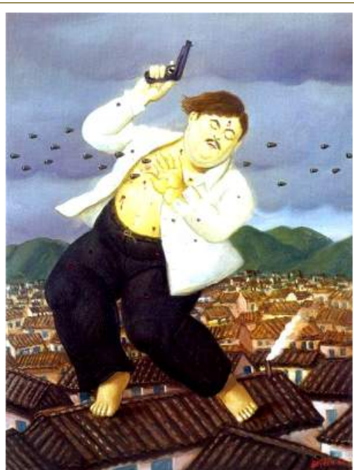
Fernando Botero, La Muerte de Pablo Escobar , Smrť Pablo Escobara.

Sami sa čudujú, prečo chce niekto cestovať po ich krajine. Ved' veľmi dobre vedia o svojej reputácii a dokonca s ňou súhlasia. Pripomínajú im to každý deň úradníci na ambasádach, keď sa snažia získať víza do zahraničia, colníci na letiskách, keď ich vedú do izolovaných miestností na osobnú kontrolu od zubnej pasty po konečník. Ak doma stretnú cudzinca, okamžite sa zapína ich ochranný komplex. Vy musíte byť dobrý človek, ak ste prišli do ich zlej krajiny. Nevedia, ako vyzerajú okolité štáty, Venezuela s permanentnými útokmi na turistov a Brazília s pouličnou kriminalitou, siahajúcou do astronomických čísel. Ľudia vás zastavujú na ulici, len tak, z ničoho nič, a pýtajú sa na váš pôvod, na to, kam cestujete a prečo ste si vybrali práve Kolumbiu. Dostanete ten najkrajší a najúprimnejší úsmev, starostlivú otázku, či poznáte cestu a neraz kvôli tomu zalarmujú iných chodcov či dokonca policajta. Často vás pozvú domov, na ryžu s fazuľou a vyprážaným banánom, budú počúvať o vašich cestách a o svojej krajine, ktorú poznáte lepšie, ako oni sami. Bolo by to krásne, ale je to nekonečne smutné: pošliapané sebavedomie, kolektívne zlyhávanie vyrovnat' sa s vlastnou minulosťou. Zatiaľ.