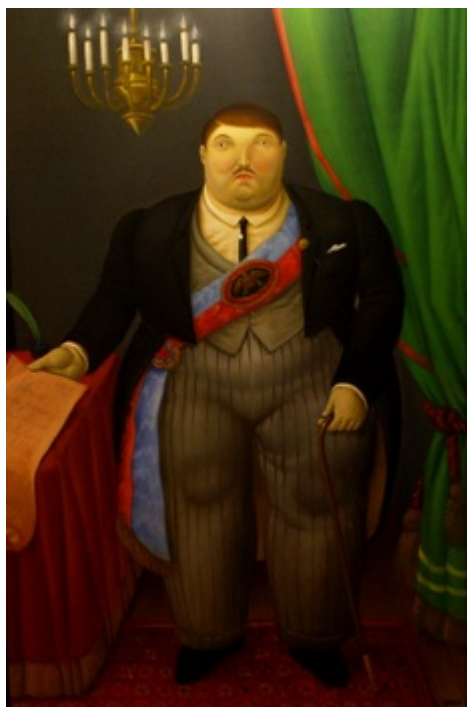
Fernando Botero, EL Presidente, Prezident

Najprv to vyzeralo ako všetky predošlé výbuchy bojov medzi miestnymi odvekými nepriateľmi, liberálmi a konzervatívami. Desaťročie od roku 1948 sa označuje názvom, šokujúco krátkym a výstižným: La Violencia, Násilie . Išlo o to, že centralistickí konzervatívci trochu pritlačili na záujmy statkárov a obchodníkov, ktorí vládli vďaka peniazom v regiónoch a ich liberalizmus spočíval najmä v nechuti voči plateniu daní vláde v Bogote. Jednotlivé nálepky ani bezprostredné motívy však vôbec nie sú dôležité: ani jedno, ani druhé nijako neobjasňuje, ako vlastne Violencia vznikla, a najmä, prečo. Isté je, že po dvoch rokoch eskalácie napätia vybuchol v roku 1948 ten najkrutejší vnútroštátny prejav politickej nenávisťi, aký tento kontinent zažil od čias vyhľadania domorodcov. No tí sa nerátajú, všakže.